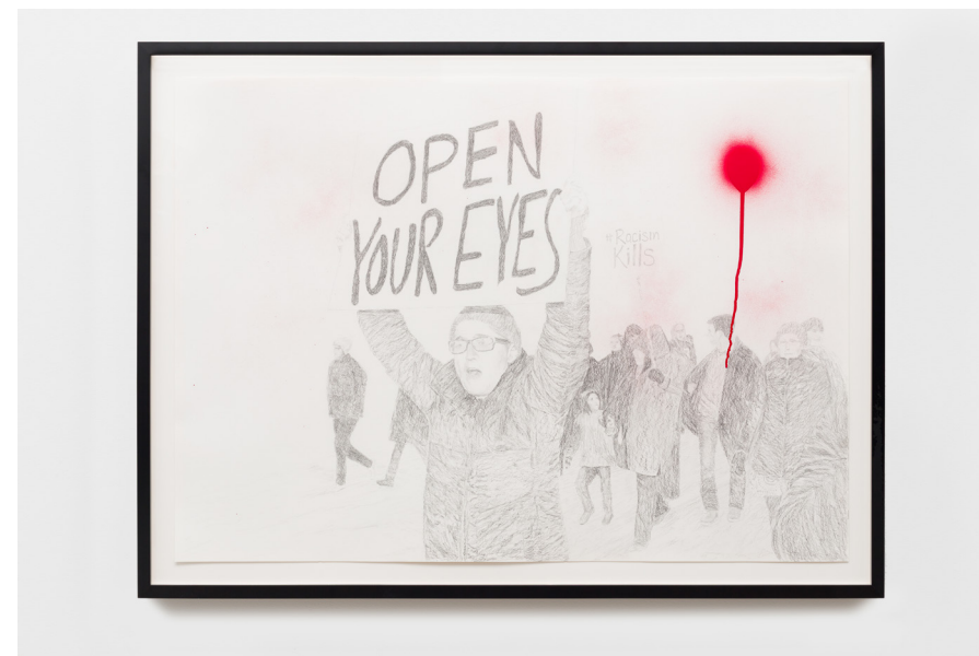
Open Your Eyes , 2022 Graphite and spray enamel on paper 73 x 102 cm 28 3/4 x 40 1/8 in 83.5 x 112 cm (framed) 32 7/8 x 44 1/8 in (framed)