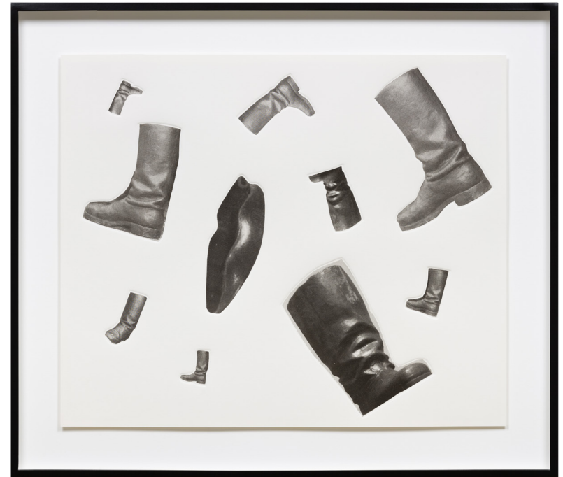
Boots And Mouth, 2020 Offset lithography on gampi paper; chine collé on Fabriano 290gsm paper 50,8 x 60,9 cm 20 x 24 in 65 x 75 x 5 cm (framed) 25 5/8 x 29 1/2 x 2 in (framed) Edition 3 of 3