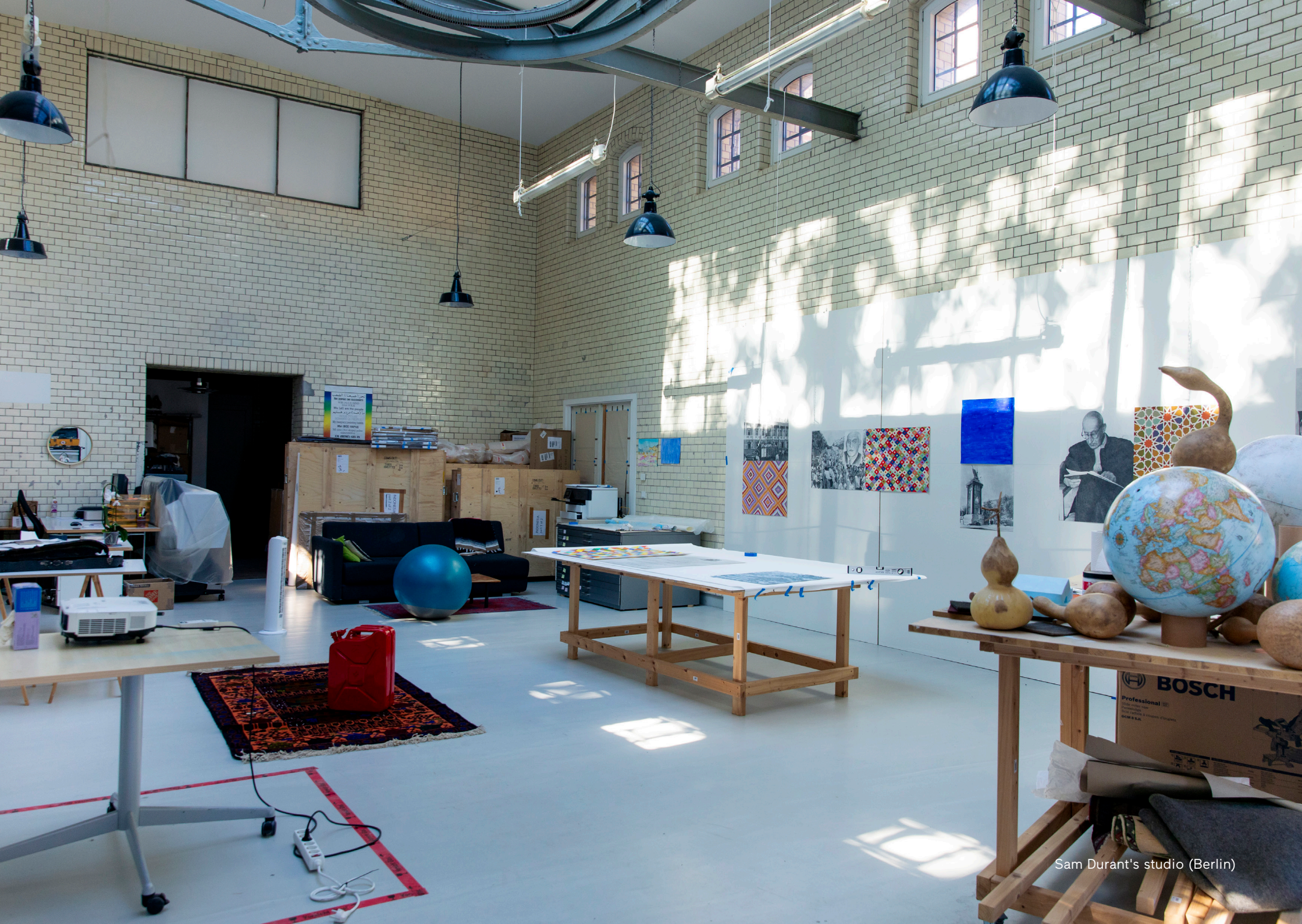
Sam Durant's studio (Berlin)