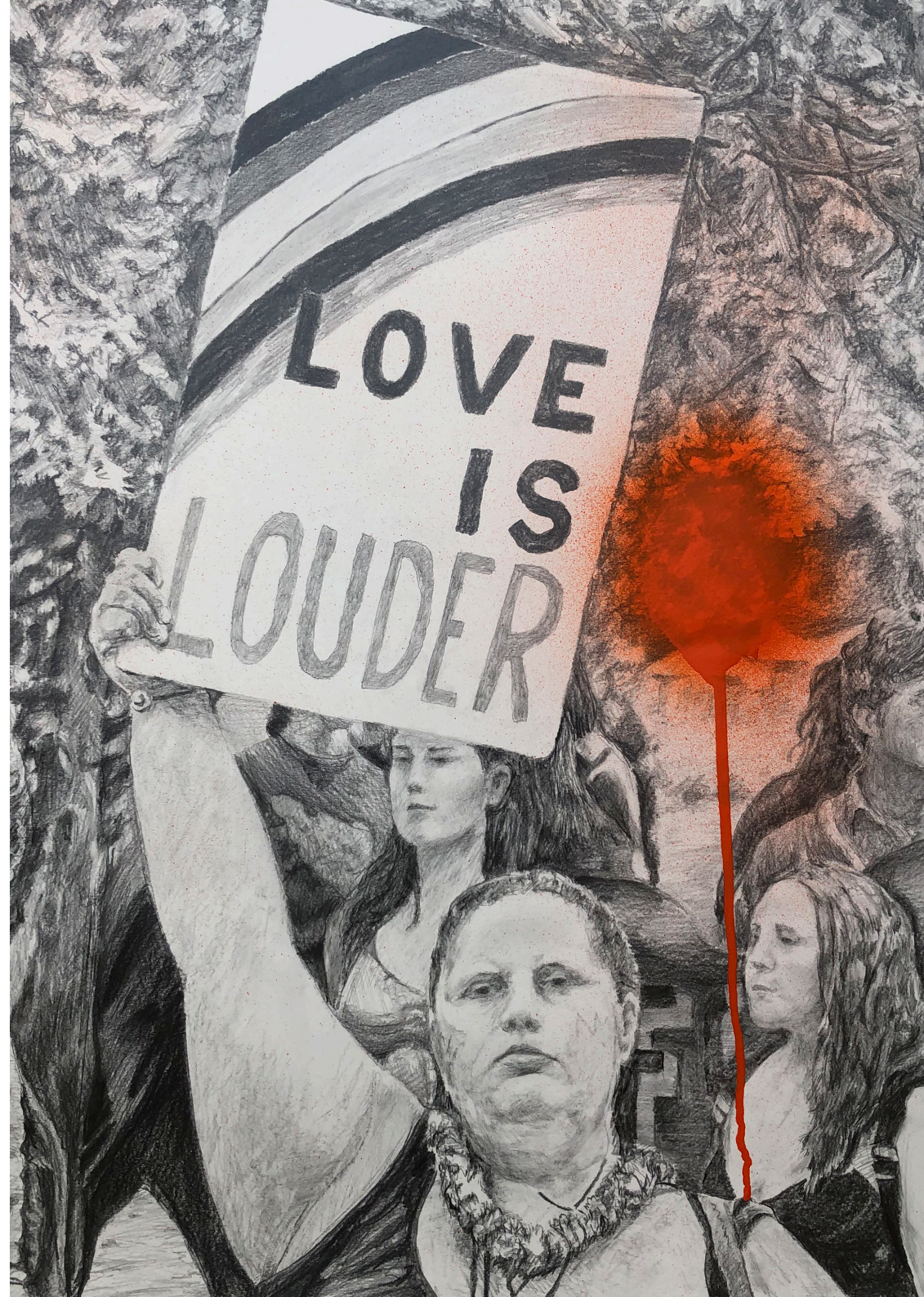
Love Is Louder (Index) , 2023 Graphite and spray enamel on paper 23 5/8 x 19 3/4 in (unframed) 60 x 50 cm (unframed)