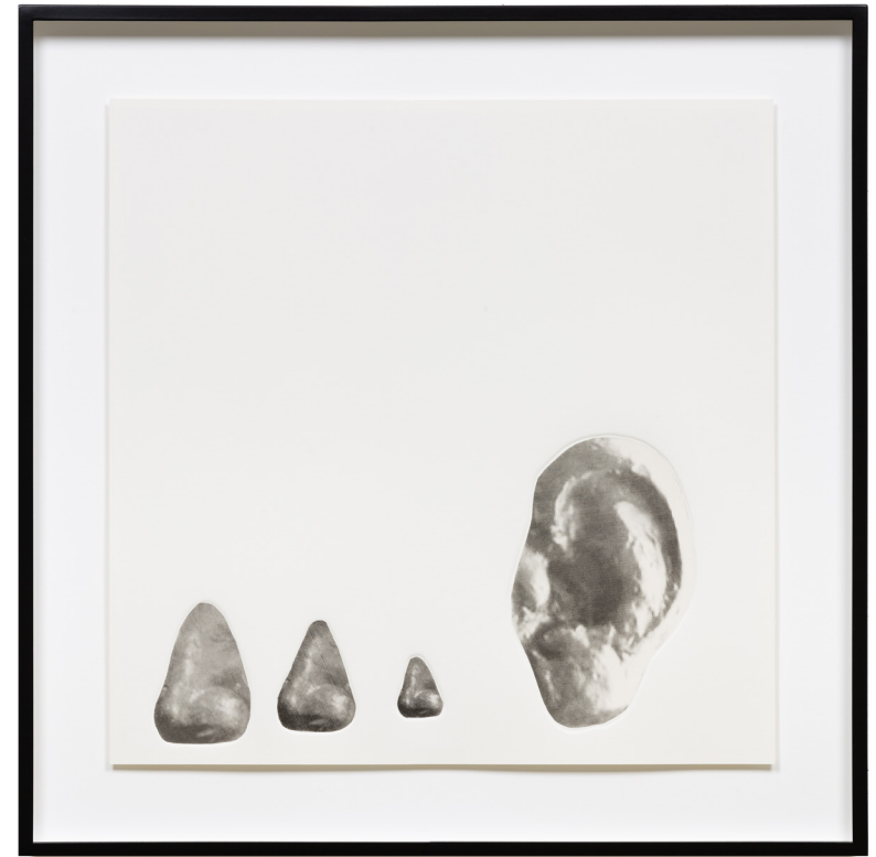
Ears And Noses, 2020 Offset lithography on gampi paper; chine collé on Fabriano 290gsm paper 50,8 x 50,8 cm 20 x 20 in 65 x 65 x 5 cm (framed) 25 5/8 x 25 5/8 x 2 in (framed) Edition 3 of 3