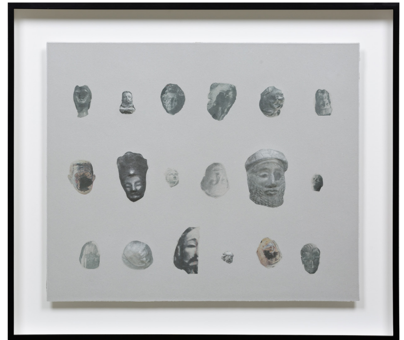
Heads, 2020 Inkjet printing with pigment ink on gampi paper casted on handmade mulberry and cement paper, mounted on sintra 50.3 × 60.2 × 2 cm 19 3/4 × 23 3/4 in 65 × 75,5 × 7 cm (framed) 25 5/8 × 29 3/4 × 2 3/4 in (framed) Edition 3 of 3