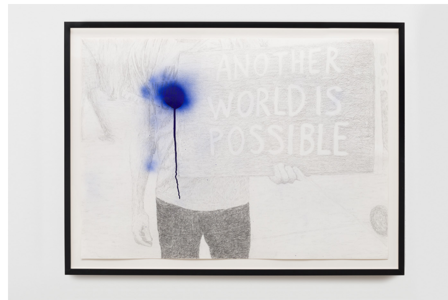
Another World Is Possible, 2022 Graphite and spray enamel on paper 73 × 102 cm 28 3/4 × 40 1/8 in 83,5 × 112 cm (framed) 32 7/8 × 44 1/8 in (framed)