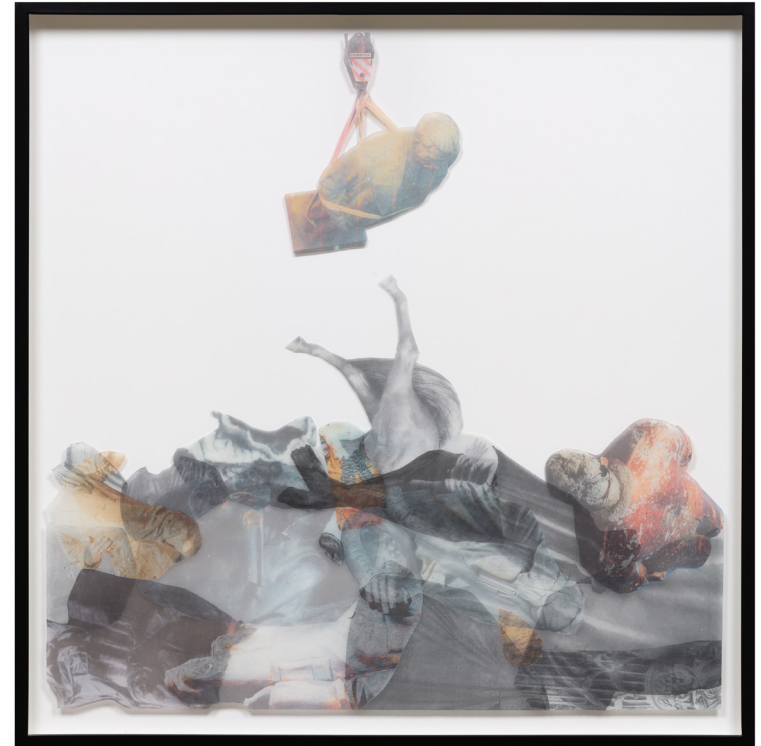
Certainty , 2020 Inkjet printing with pigment ink on gampi mounted on Optimum Museum acrylic 55,8 x 55,8 cm 22 x 22 in 56.5 x 56 x 5 cm (framed) 22 1/4 x 22 x 2 in (framed) Edition 3 of 3