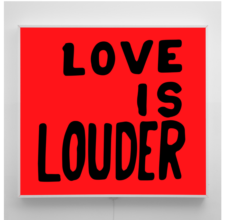
Love Is Louder, 2023 Electric sign with vinyl text 44 1/8 x 48 3/8 in 112 x 123 cm Edition AP1