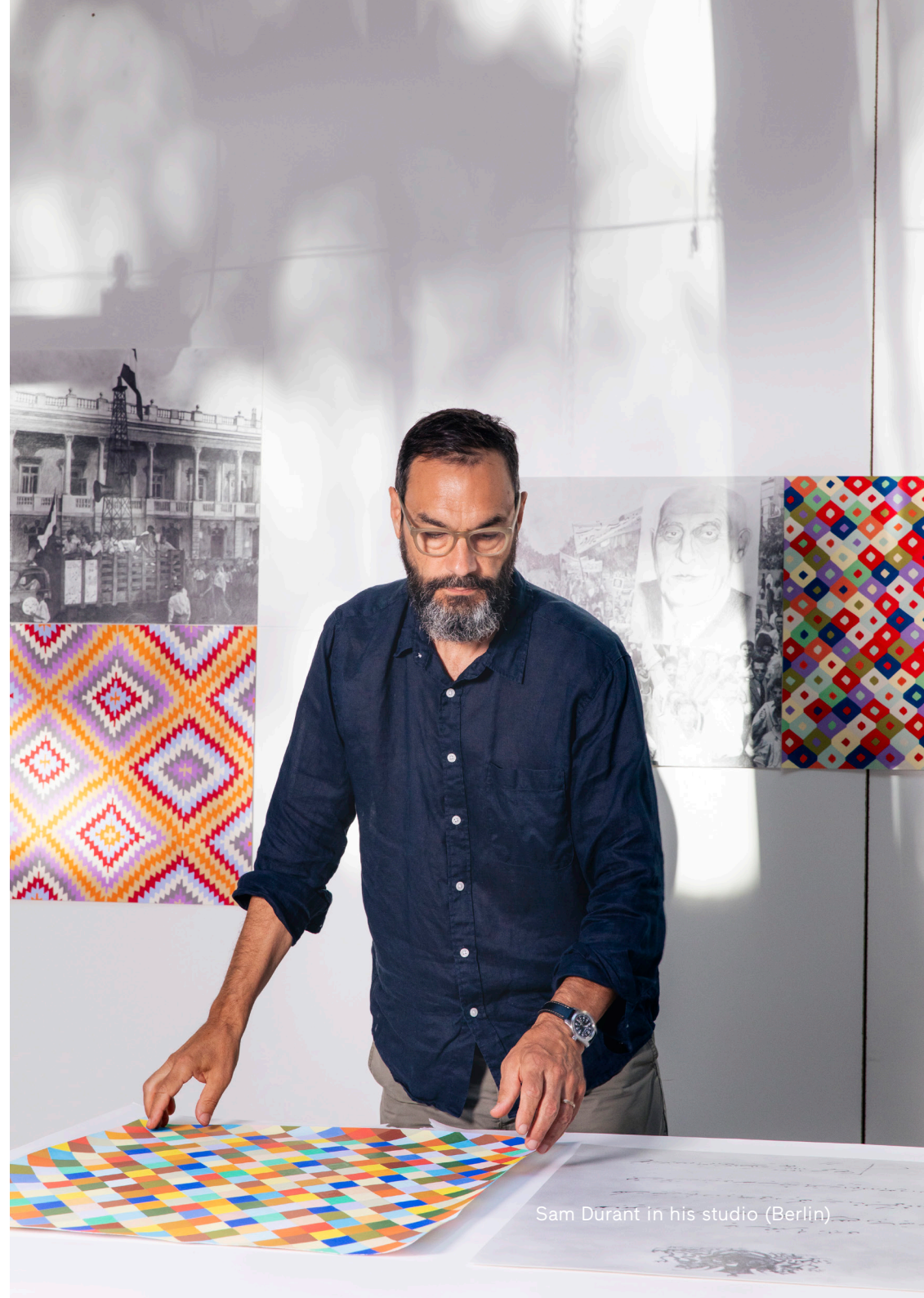
Sam Durant in his studio (Berlin)